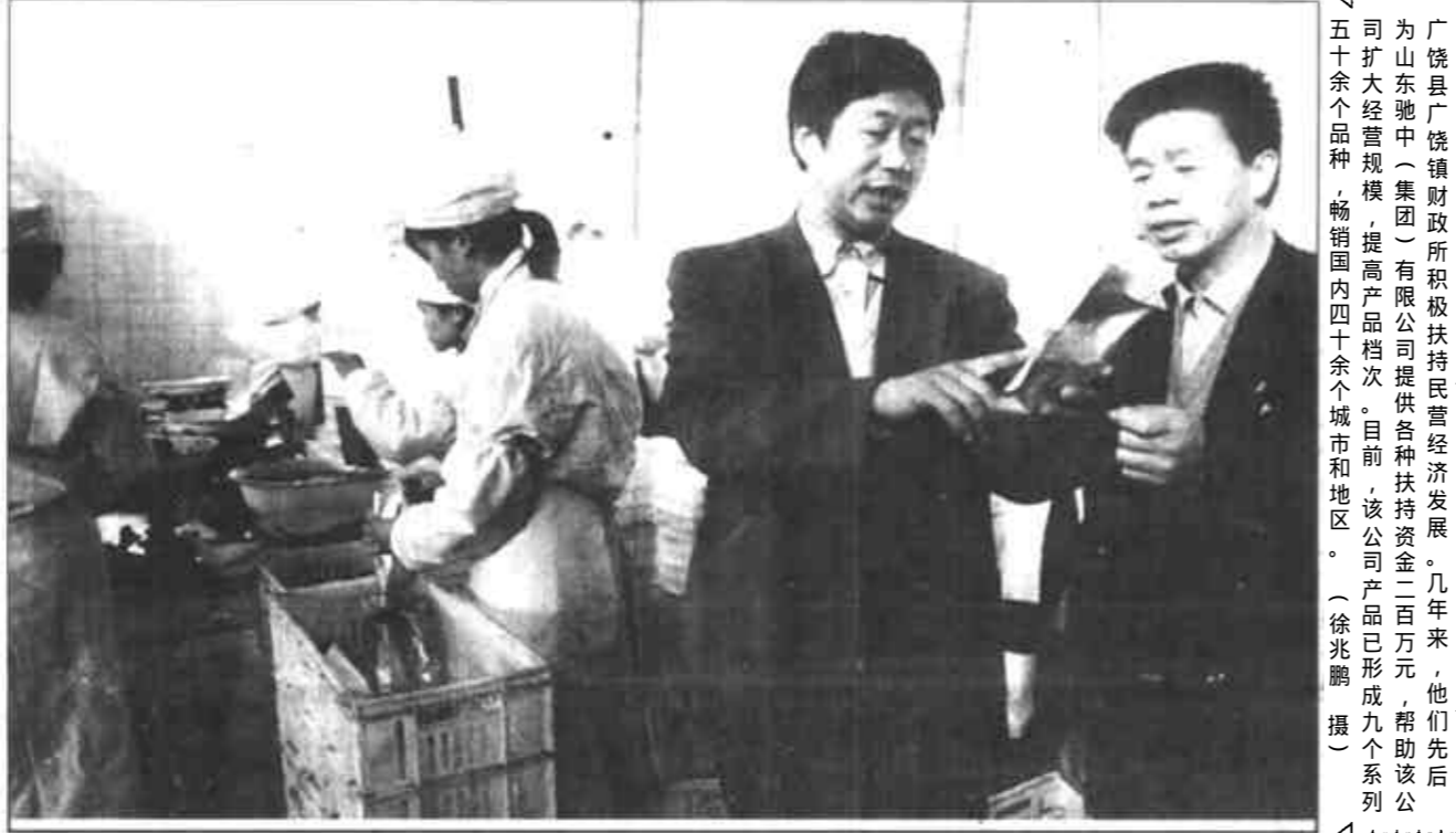
广饶县广饶镇财政所积极扶持民营经济发展。几年来，他们先后为山东地中(集团)有限公司提供扶持资金二百万元，帮助该厂扩大经营规模，提高产品档次。目前，该厂产品已打入九个省市和地区。

本报讯 12月27日上午，我市组织收听收看全省森林防火电视电话会议。副市长杨志良、东营军分区副司令员刘安明、济军生产基地副主任高其华在东营分会场参加了收听收看。 这次会议总结了去年度我省森林防火工作，认真分析了今冬明春全省森林防火工作面临的新形势，对做好当前森林防火工作提出了具体要求。 杨志良通报了前段我市森林防火工作的基本情况。他指出，森林防火工作，事关我市造林绿化成果的巩固和发展，事关人民群众的生命财产安全，事关我市的声誉和对外的形象，事关我市投资环境的改善和社会稳定。各级各有关部门必须以对党、对人民高度负责的态度，始终绷紧森林防火这根弦，把森林防火工作作为今冬明春的一件大事，放在突出位置上，切实放在心上，抓在手上，确保不出现大的问题，以实际行动实践江总书记“三个代表”的重要思想。 杨志良强调，要狠抓森林防火措施的落实、再落实。一要充分利用各种形式，加大宣传力度。二要严格值班巡查和报告制度，确保政令畅通，指挥调度及时。三要加强对野外火源的管理，坚决排除火灾隐患，真正管住火灾源头。四要修订落实灭火预案，实现扑救森林火灾组织指挥、行动预案、通讯联络、灭火机具、交通运输、后勤保障“六落实”。五要加大森林防火的投入，加强防火基础设施建设，增强防火灭火的能力。 杨志良要求，要强化责任，求真务实，切实加强森林防火工作的领导。要坚持实行各级政府行政领导负责制；各有关部门要齐抓共管，群策群治；要加强督查，严格奖惩，振奋精神，努力工作，为确保全市今冬明春不发生大的森林火灾做出新的贡献。 (记者 冯孝亭)